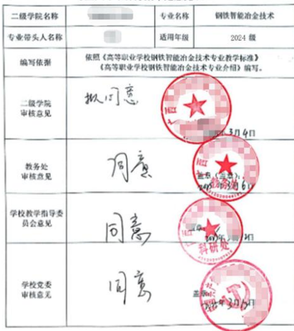
■■■■■■■■■■ 学院 专业人才培养方案审定意见表