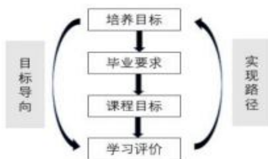
图1 专业认证理念下的学习评价体系构建思路

根据《学前教育专业认证标准》中对学前教育专业教学质量的要求，按照此标准中涉及的“培养目标、毕业要求、课程目标”三个维度，构建一个始于目标、层层递进、逐步落实的专业认证理念下的学习评价体系（见图1）。