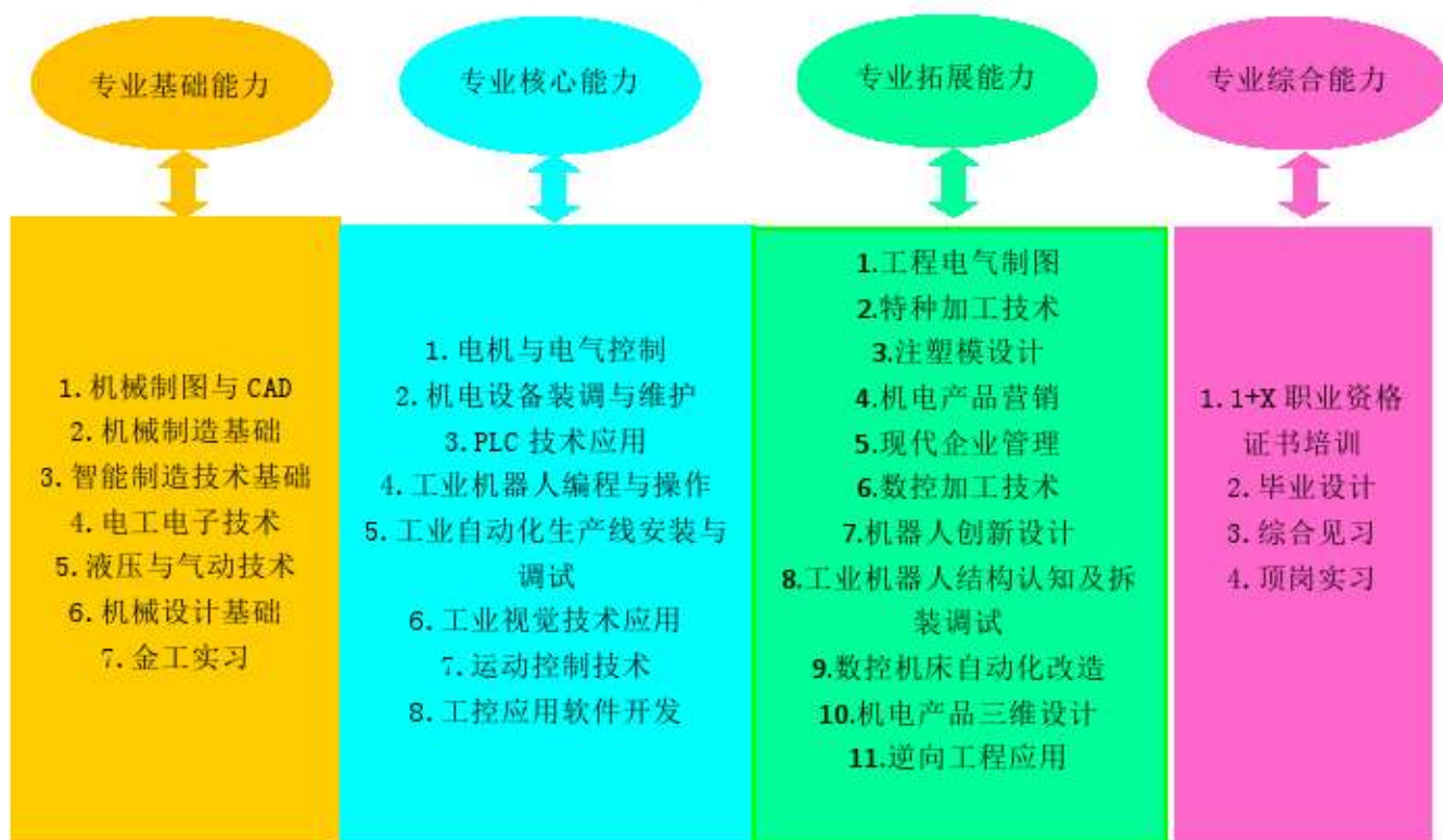
图 3 能力对应课程体系图

4. 职业综合能力：开展工业机器人应用编程 1+X 职业资格证书培训，进行毕业设计和答辩，前往企业进行综合见习和顶岗实习。