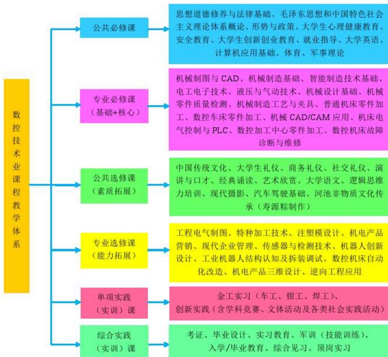
图2 机械制造与自动化专业课程体系图

1. 根据专业培养目标和人才培养规格构建课程类型和体系，由公共必修课、专业必修课和专业拓展课三大类构成：