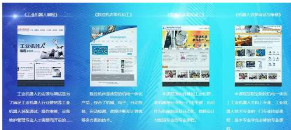
图3 校本教材教学资源库