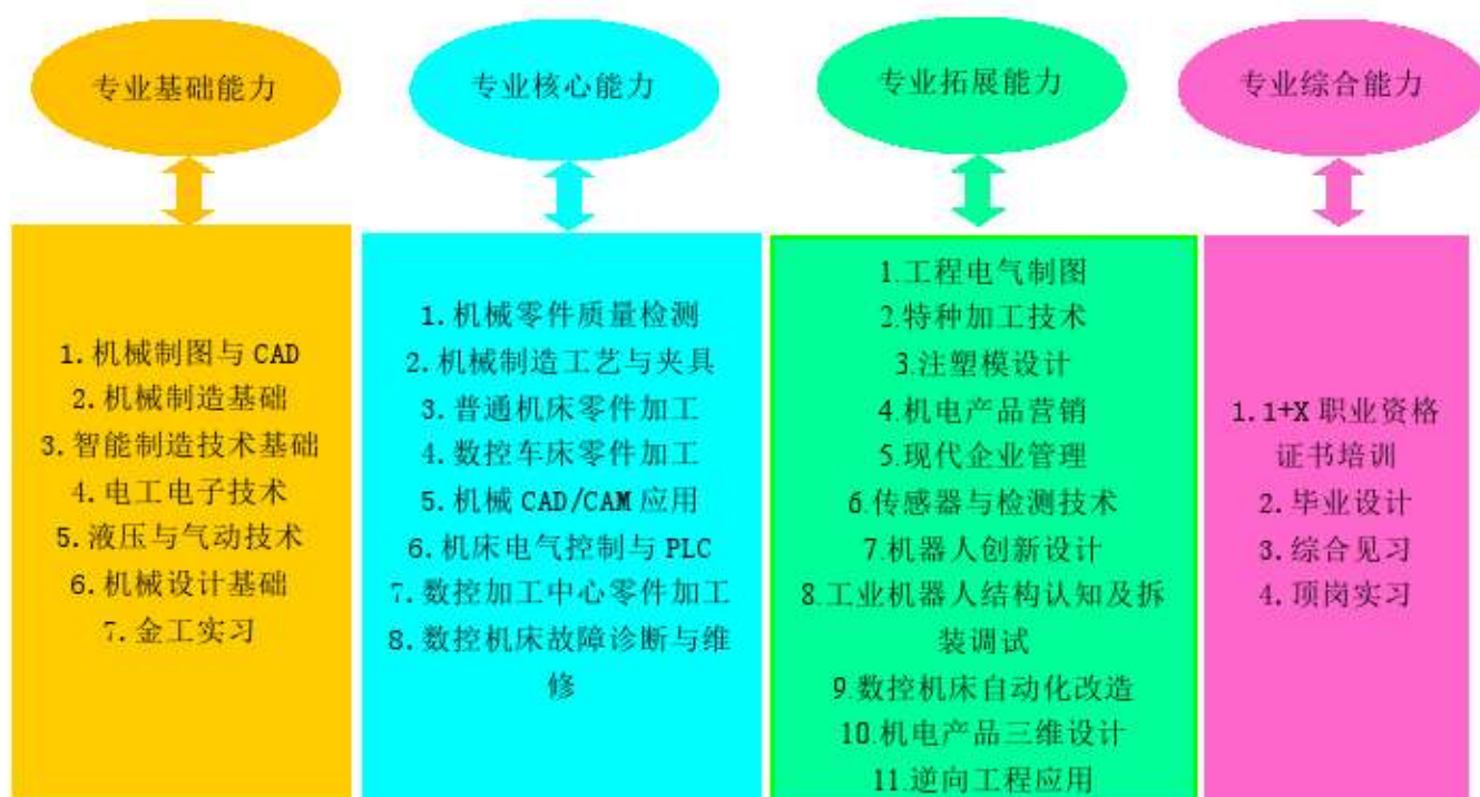
图 3 能力对应课程体系图

4. 职业综合能力：开展 1+X 职业资格证书培训，进行毕业设计和答辩，前往企业进行综合见习和顶岗实习。